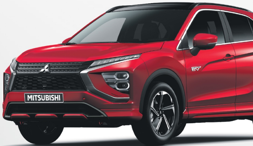
MITSUBISHI ECLIPSE CROSS PHEV